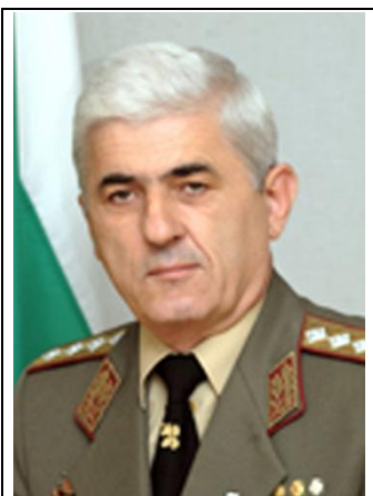
ген. о.з. Златан Стойков

Уважаеми госпожи и господа членове на Съюза на офицерите и сержантите от запаса и резерва, офицери и сержанти от запасното войнство,